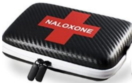
Fuente: www.ncsl.org [buscar "overdose immunity" (inmunidad a la sobredosis)]

Las "leyes del buen samaritano" protegen a las personas que llaman al 911, las víctimas de sobredosis o las personas que intentan salvar una vida como resultado de una sobredosis de drogas. Estas leyes en los EE.UU. y Canadá también protegen contra el arresto y/o enjuiciamiento por simple posesión, posesión de parafernalia y/o estar bajo la influencia en una situación de sobredosis. Estas leyes ayudan a decenas de miles de reversiones de sobredosis cada año. También protegen a una persona que administra un medicamento de rescate por sobredosis de opioides llamado naloxona. (La forma de aerosol nasal se puede administrar a una víctima de sobredosis inconsciente). La mayoría de las farmacias e incluso los minoristas en línea venden este medicamento de rescate sin receta. Si tiene un familiar, un ser querido o un amigo que lucha contra la adicción a los opioides, obtenga información sobre las leyes del Buen Samaritano, tenga un equipo de medicamentos de rescate, sepa cómo usarlo y esté preparado. Por tan solo $ 7, podría salvar una vida.