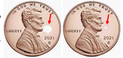
Fentanyl Dosis letal

que el fentanilo. Estas drogas se venden ilícitamente y son letales en cantidades extremadamente pequeñas (ver imagen). Es imposible saber en qué medida, e incluso si, cualquiera de estas drogas se puede mezclar con otras drogas vendidas ilícitamente. Este fenómeno es cada vez más común y causó más de 70.000 muertes por opioides en los EE.UU. y Canadá en el último año. Esto hace que la intervención para que las personas drogodependientes reciban tratamiento sea más crucial que nunca. Hable con profesionales con conocimiento de la intervención si está preocupado por un ser querido. Comience con SAVE de su empresa. Además, considere unirse a un grupo de apoyo adecuado que lo ayude a energizar su deseo de poner fin a la capacidad de su ser querido y potenciar el cambio en la relación que hace que el tratamiento no sea negociable.